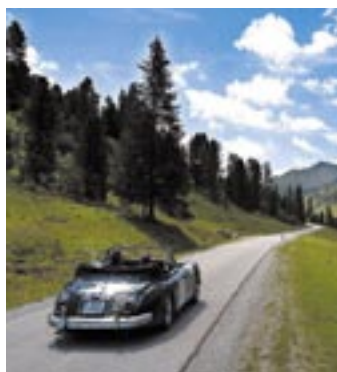
Autofahren im letzten Paradies APA