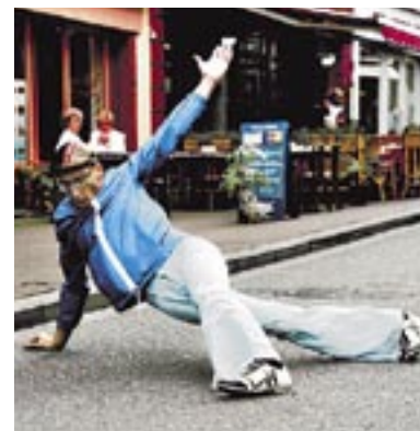
Umwerfend: La Strada lockt mit 300 Künstlern LA STRADA