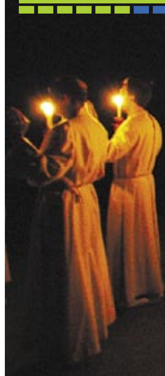
Heuer mit von der Landpartie: Sarband,