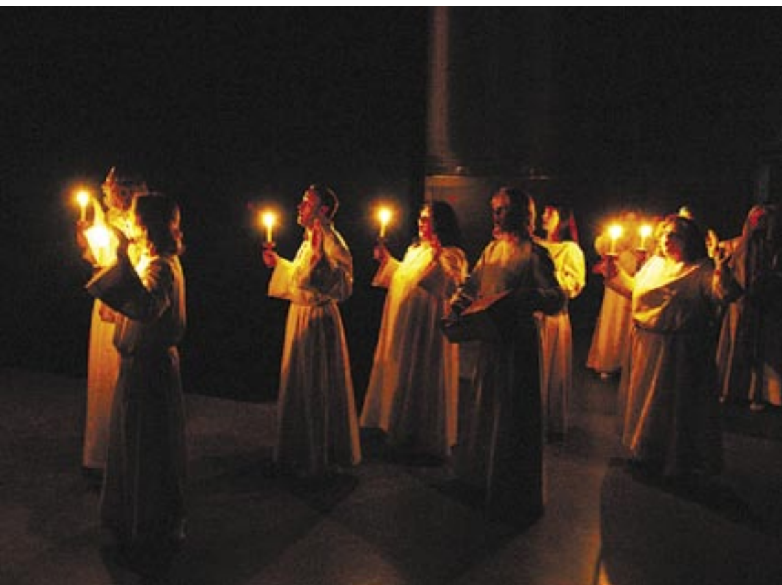
ein Münchner Ensemble für Alte Musik, bringt um Mitternacht sufische Musik und italienische Laudes