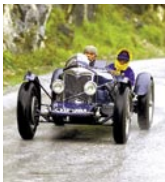
Das Blech der frühen Jahre APA