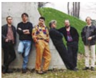
Die „Broadlahner“ spielen beim Festival in Gamlitz

Dass Gamlitz nicht nur für den Welschriesling, sondern auch für Blues und Jazz ein fruchtbarer Boden ist, beweist das alljährliche „Summertimeblues“-Festival im Schloss des Weinortes. Von 8. bis 10. Juli musizieren dort u. a. Broadlahn, die Bluesbreaker, Marianne Mendt sowie die Boring Blues Band. Summertimeblues. Schloss Gamlitz. 8. bis 10. Juli. Tel. (0 34 53) 23 63. Programm: www.summertimeblues.at