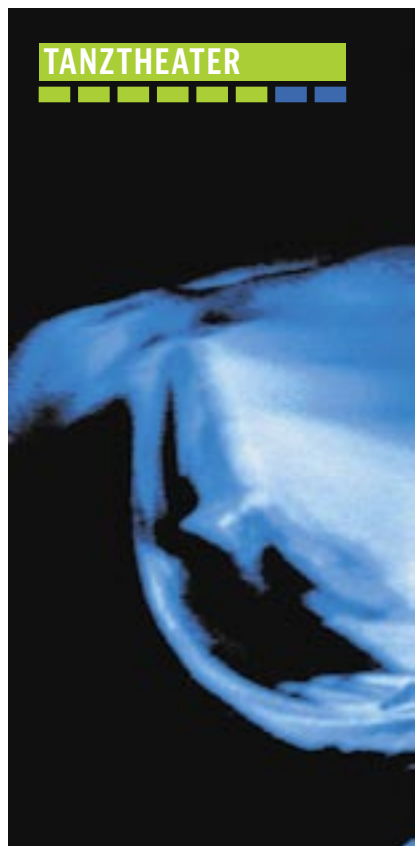
Der brasilianische Ausnahme-Performer

Int. Tanztheaterfestival. Kunstuniversität Graz, Leonhardstr. 15. 10. bis 24. Juli. Karten: Tel. (0 31 6) 32 10 34. Infos: www.buehnenwerkstatt.at