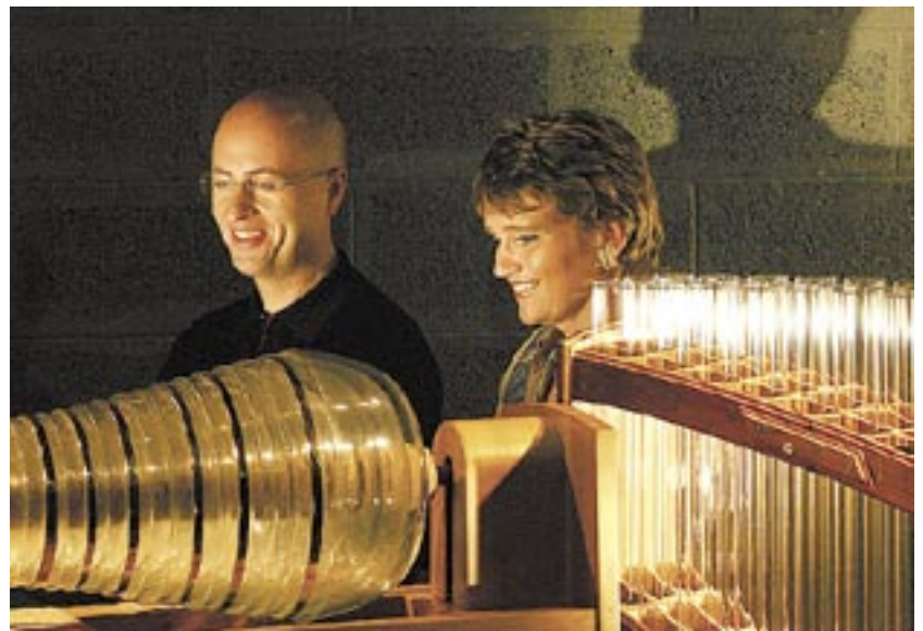
Die Glasharmonika wurde 1761 von Benjamin Franklin entwickelt.

Gerald Schönfeldinger sphärische Klänge. Gestaunt werden kann heute schon ab 15 Uhr im Dom des Waldes auf der Heblalm. KK