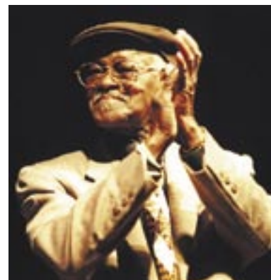
Applaus: Ibrahim Ferrer beehrt den Jazzsommer UTRI