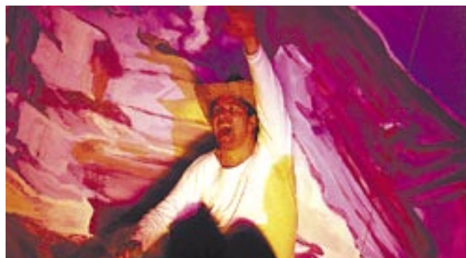
Der Roman „Stiller“ von Max Frisch als buntes Bühnenwerk

Stiller. Schauspielhaus Graz, Hauptbühne. 14. und 15. Juni, 19.30 Uhr. Karten: Tel. (0 31 6) 80 00. www.theater-graz.com