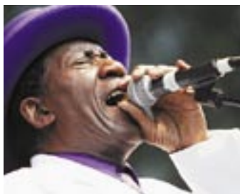
„New Orleans meets Leoben“: Ein Fest für Augen und Ohren

New Orleans meets Leoben. Innenstadt. 11. und 12. Juni. Eintritt frei. Tel. (0 38 42) 48 1 48. www.leoben.at