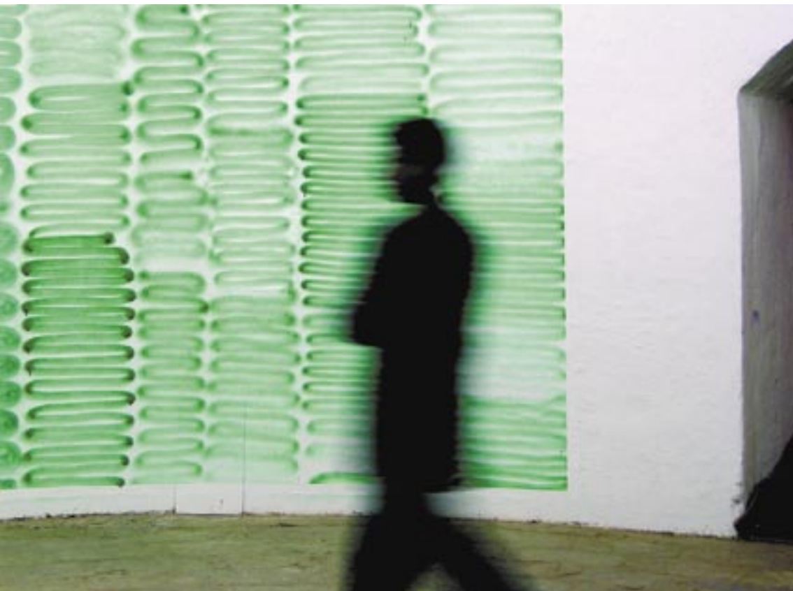
Renée Levi arbeitet mit Licht und Farbe, oft reagiert sie gezielt auf spezielle Raumsituationen