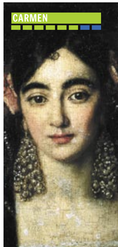
Die Joanneum-Schau „Blicke auf Carmen“

Blicke auf Carmen. Landesmuseum Joanneum, Graz, Neutorgasse 45. Eröffnung: 24. Juni, 19 Uhr. Bis 4. 9. www.museum-joanneum.steiermark.at