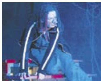
Quasimodo darf bei der „Starnight of Musicals“ nicht fehlen KOREN

Starnight of Musicals. AK-Säle Graz, Strauchergasse 32. 17. Juni, 19.30 Uhr. Karten: Tel. 0800-875 875 11. www.musical-moments.at